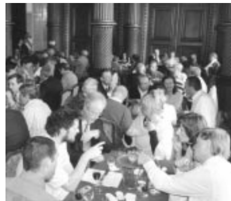
Repas dans la salle du conseil au palais des Princes Evêques de Liège lors du cinquième trophée et trentième anniversaire de QVW.

48 comités ont été sollicités pour remettre leur candidature. Actuellement, 12 ont déjà répondu à l'appel dont Qualité Village Othée (Lg), L'amicale de l'école de Hachy (Lx), Culture et Patrimoine de Ch ê e-Notre-Dame-Louvignies (H), Les archives de Boignée (N). Les autres ont jusqu'au 10 juillet 2007 pour se décider.