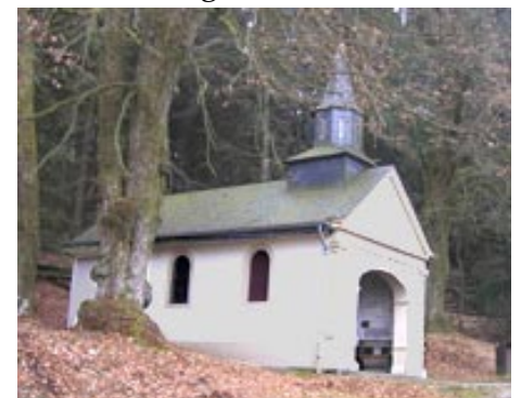
Chapelle de Notre-Dame de Grâce d'Habay-la-Neuve

Il est opportun de souligner la nécessité de l'entretien de nos chapelles, car leur signification va au-delà des souvenirs du passé, elles font partie de la vie de nos villages.