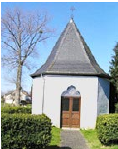
Chapelle de Hachy

Il estime alors que sans avoir en main des éléments comparatifs, sans une analyse typologique préalable de ce genre de bâtiments, le classement aurait un caractère un peu aléatoire, serait le résultat d'une initiative certes louable mais équivoque.