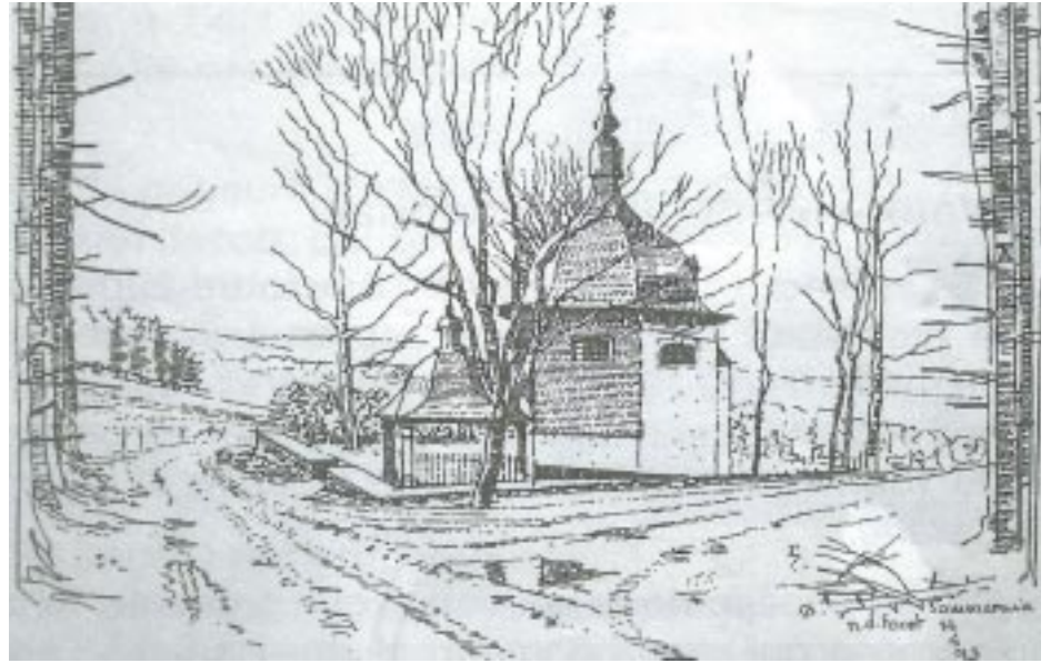
Houffalize-Sommerain. Notre-Dame de la Forêt. Dessin E. Van Caster.