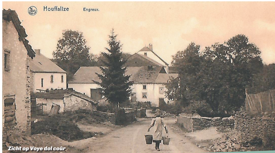
Zicht op Voye dol coür