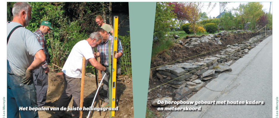
Het bepalen van de juiste hellingsgraad