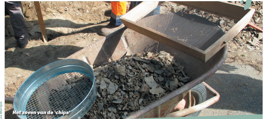
Het zeven van de 'chips'

Er is echter nog veel werk te doen en we zijn van plan het project voort te zetten.