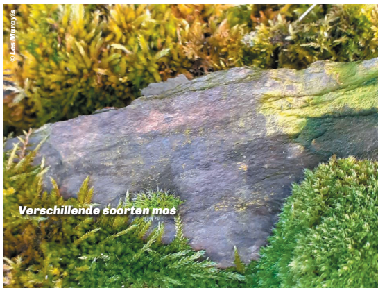
Verschillende soorten mos

... de kennis en de knowhow van stapelmuurbouw in 2018 door UNESCO erkend werd als immaterieel cultureel erfgoed? Stapelmuurbouw wordt sinds 2010 ook in Wallonië erkend als 'Waal volkerfgoed' en kan genieten van restauratiepremies, een groot voordeel voor eigenaars. Voor meer informatie, raadpleeg de website van het Agentschap voor het Waals Erfgoed. De landelijke identiteit wordt bewaard door de elementen waaruit het bestaat, te herstellen.