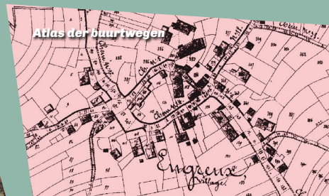
Atlas der buurtwegen

In 1766 geeft een volkstelling in Engreux 132 inwoners aan: er waren 25 gezinnen en 25 huizen. In 1952 waren er 250 inwoners. Dit aantal is sindsdien terug gedaald als gevolg van de uittocht van het platteland naar de steden en de daling van het geboortecijfer.