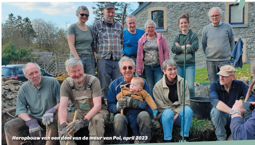
Heropbouw van een deel van de muur van Pol, april 2023