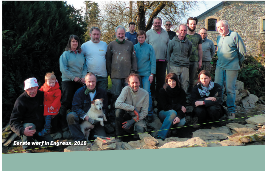
Eerste werf in Engreux, 2018

De 'Murayïs' . Bij de opstart van het restauratieproject van de oude stapelmuren in Engreux, nam het 'Syndicat d'initiative Confluent des deux Durthes' contact op met verschillende eigenaars van oude stapelmuren die zichtbaar zijn in het centrum van het dorp. Hierop heeft zich een dorps-, participatief en burgerproject ontwikkeld. In 2018 koos deze groep dorpingen de naam 'Murayïs', een samentrekking van 'muraillieurs' (muurbouwers) en 'rayïs' (Waals voor 'daas' (= vliegensoort): bijnaam van de inwoners van Engreux).