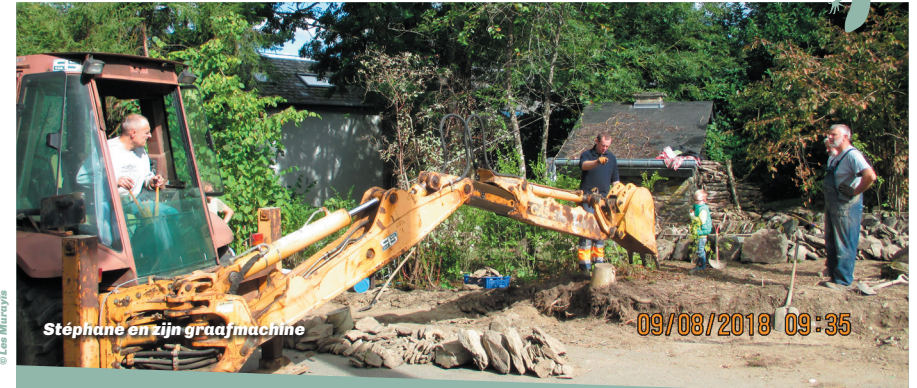
Stéphane en zijn graafmachine

Tot op heden zijn de stapelmuren van 5 eigenaars aangepakt. De muren werden ontmanteld, de stenen werden gesorteerd, de lastige bomen werden verwijderd en ontworteld en daarna werden de muren weer opgebouwd volgens de regels van goed vakmanschap (zonder mortel en volgens een welbepaalde stapeltechniek). Een 'reserve' van stenen in het dorp werd teruggevonden en gerecycled dankzij de schenking van een bewoner: een oud huis was gesloopt. Een team van een tiental gemotiveerde dorpingen oefende op een eerste muur, met als doel samen de restauratie van de bestaande stapelmuren in het hart van het dorp voort te zetten.