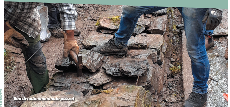
Een driedimensionale puzzel