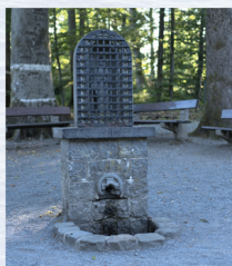
Fontaine Saint-Méen, Bruly-de-Pasche (Couvain), place Saint-Méen, 1855 (rénovation 1935).

Depuis 1855, le village rend hommage à son saint patron lors d'un pèlerinage dont la dernière station est la fontaine Saint-Méen. Une statue du saint, œuvre d'Henry Briffaut, y est placée dans une niche. L'eau de la source contient, en effet, du soufre qui est un bon désinfectant pour la «guérison» des dartres, de l'eczéma et d'autres maladies cutanées.