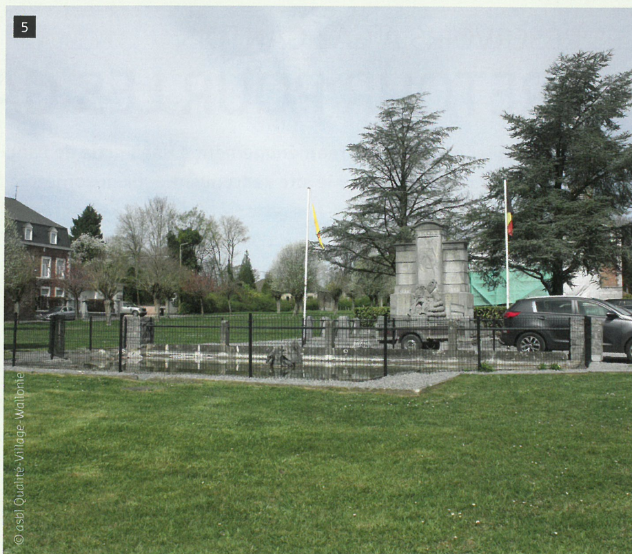
5 Le projet citoyen rend au monument aux morts sa fonction mémorielle.

Na deze fase is het aan de gemeentelijke. Il appartient à l'administration communale de s'occuper du financement et de l'exécution des travaux lorsqu'ils impliquent le remaniement ou la réfection de la voirie. L'intervention bénévole est généralement complémentaire et se concrétise par différentes actions selon les besoins. Généralement, le groupe villageois s'occupe du nettoyage du site préalablement aux travaux. Il s'engage également à participer aux plantations. Il se préoccupe aussi de l'entretien du site en assume partiellement la responsabilité. Un tel projet