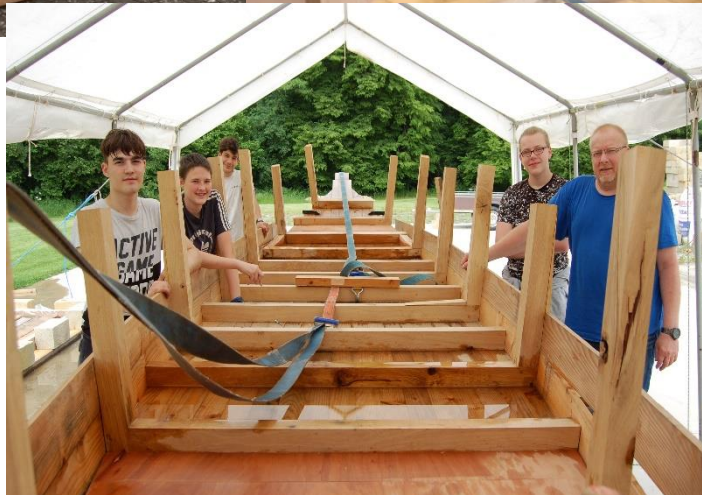
IMP Val d'Aisne 1