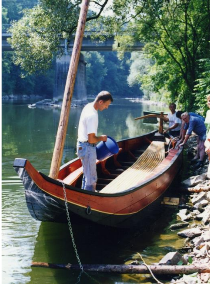
Exposition à Esneux 2017